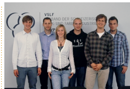
Die aufgeweckte Gruppe der Studenten aus Esslingen

La recherche de la relève pour l'industrie des vernis et peintures représente un grand défi pour l'association. La Haute école d'Esslingen est l'une des seules à former des ingénieurs en vernis et peintures. Par conséquent, l'association entretient un échange intense avec cette école du sud de l'Allemagne. Dans ce cadre, elle a offert à des étudiants sélectionnés de la HE d'Esslingen la possibilité d'apprendre à connaître l'industrie suisse des vernis et peintures. Un riche programme attendait les étudiants après une brève introduction au siège de l'association à Winterthur. Pour tous les participants, cette excursion a été un événement très profitable. Pour les jeunes hôtes, ce fut un événement marquant et pour l'industrie suisse des vernis et peintures, l'occasion de se présenter sous son meilleur jour.