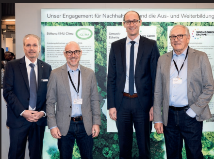
Rupf & Co. AG