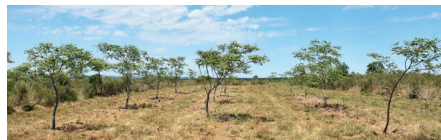
Bäume auf der Länderei in Treinta y Tres / Arbres plantés dans la province Treinta y Tres