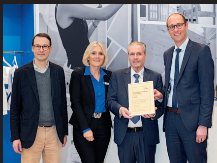
Schweizerischer Maler- und Gipser- unternehmer-Verband SMGV Association suisse des entrepreneurs plâtriers-peintres ASEPP