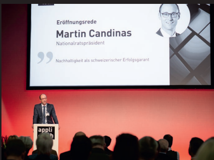
Nationalratspräsident und Stiftungsrat KMU Clima Martin Candinas Président du Conseil national et membre du conseil de la Fondation PME Clima Martin Candinas

L'appli-tech 2023 a été un grand succès! Près de 10'000 professionnels ont visité le salon et ont vécu un rendez-vous de la branche de grande qualité avec des inputs variés pour leur travail quotidien. Ci-dessous, quelques impressions de la cérémonie d'ouverture avec le président du Conseil national Martin Candinas et de la visite qui a suivi auprès des participants de la Fondation PME Clima présents au salon.