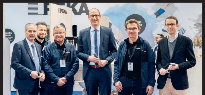
PEKA Pinselfabrik AG