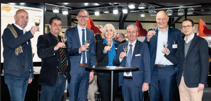
Alfons Hophan AG