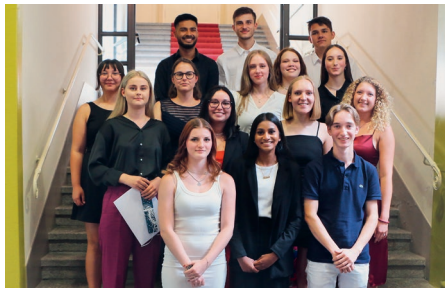
Die Abschlussklasse des Jahres 2022 La classe terminale de l'année 2022