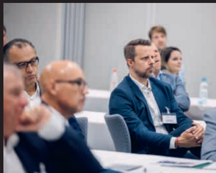
Die Teilnehmer verfolgen gespannt die Generalversammlung. Les participants suivent l'Assemblée générale avec intérêt.