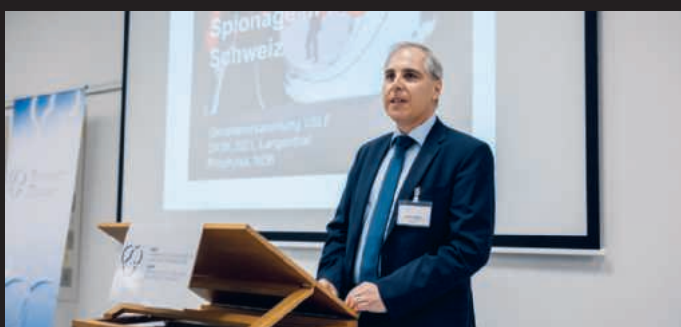
Gastredner/Orateur invité Marco Salituro, Nachrichtendienst des Bundes